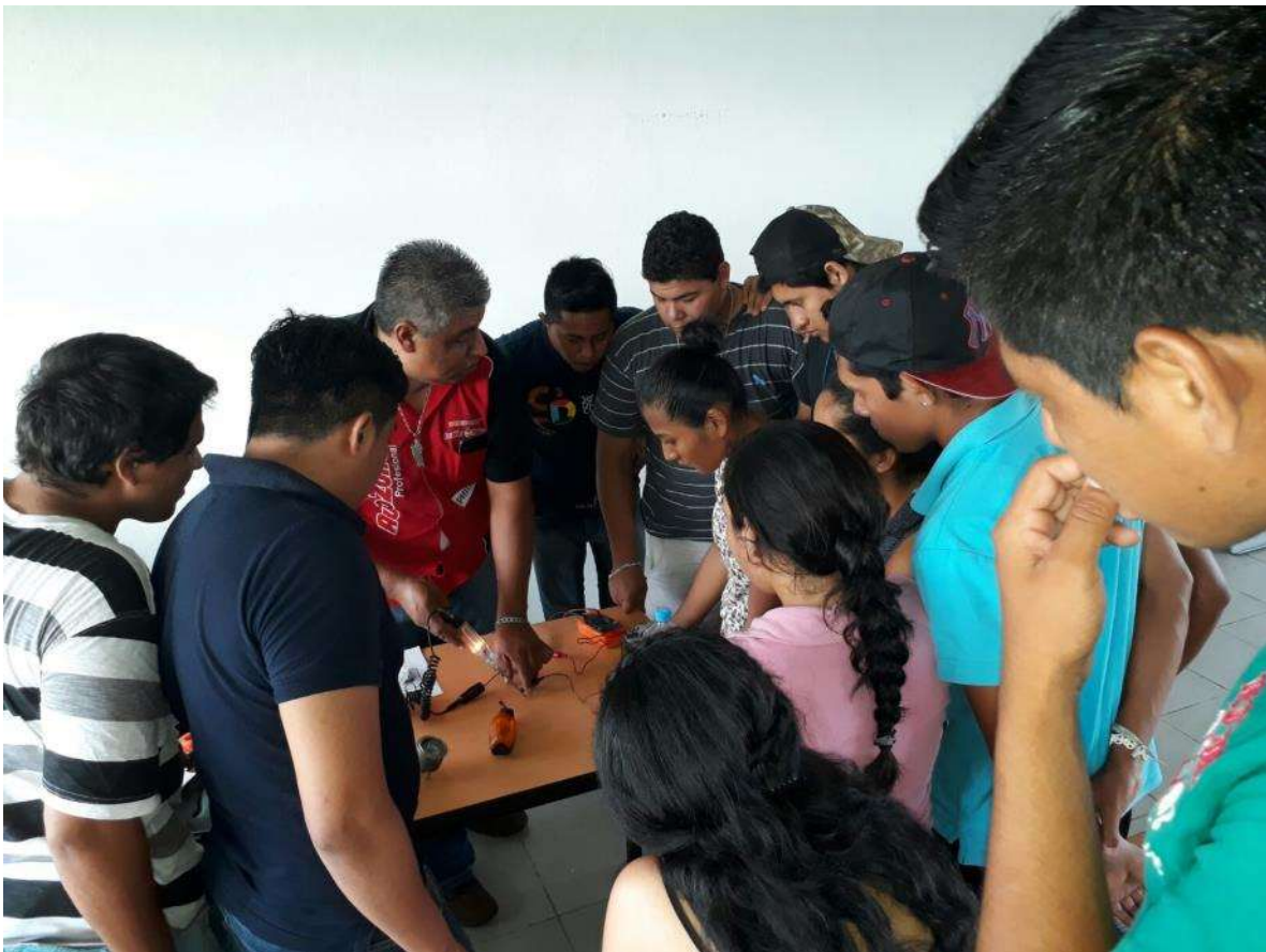
Alumnos de Ingeniería Industrial Tamuín, fuente archivo.

La institución entiende por interculturalidad un “momento social” de construcción de una renovada identidad integradora que pretende reconciliar los saberes ancestrales con las sociedades de conocimiento. Una articulación de valores filosófico-sociales que pueden ser catalizadores de una redistribución de los valores económicos, tecnológicos y sociales.