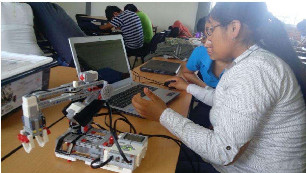
Alumnos de Ingeniería Industrial Tamuín, fuente archivo.