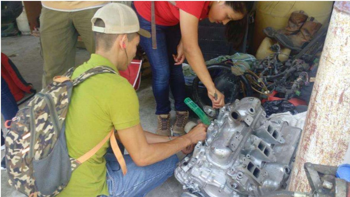
Alumnos de Ingeniería Industrial Tamuín, fuente archivo.