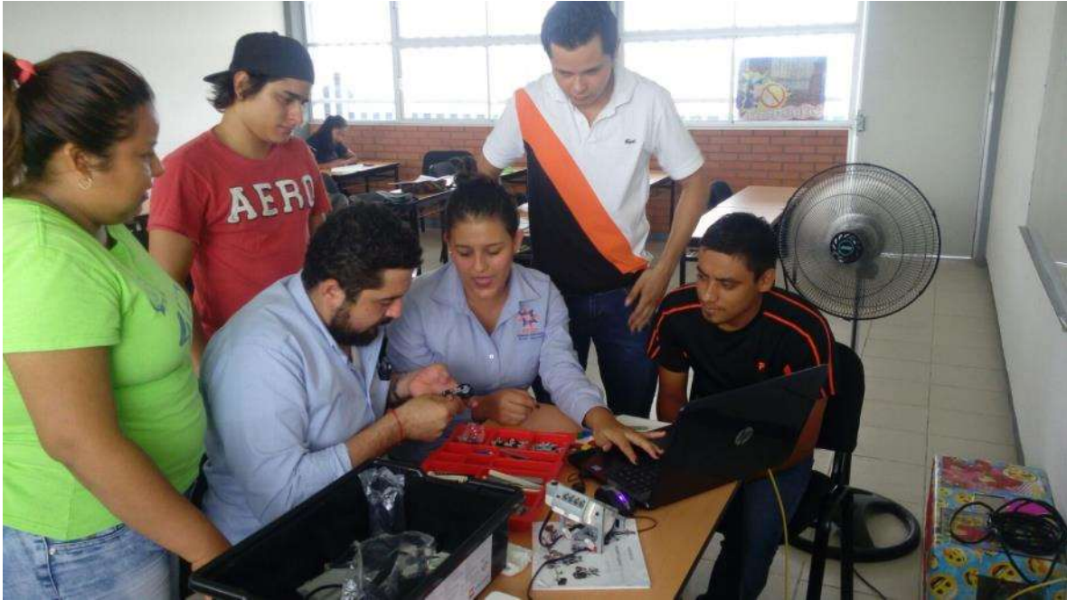
Alumnos de Ingeniería Industrial Tamuín, fuente archivo.