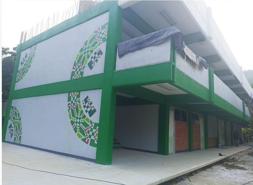
Obra en proceso Matlapa.

Seguir impulsando proyectos estratégicos que respondan a las necesidades locales y regionales será fundamental para consolidar a la UICSLP como un motor de transformación social e intercultural en San Luis Potosí.