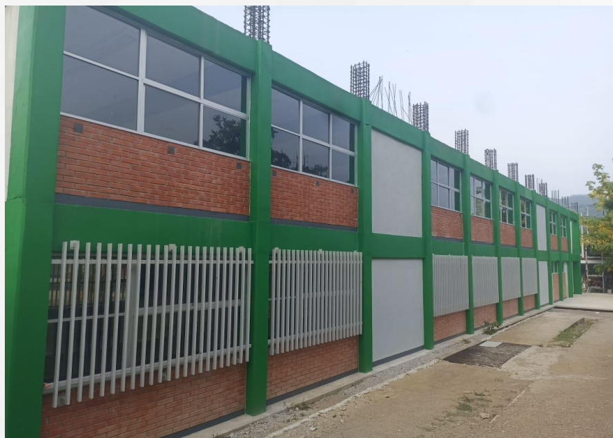
Obra en proceso Matlapa, fuente archivo.